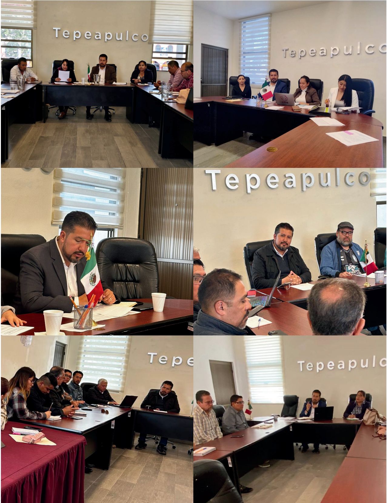
Sesiones de las Comisiones de Asentamientos Humanos y Gobernación