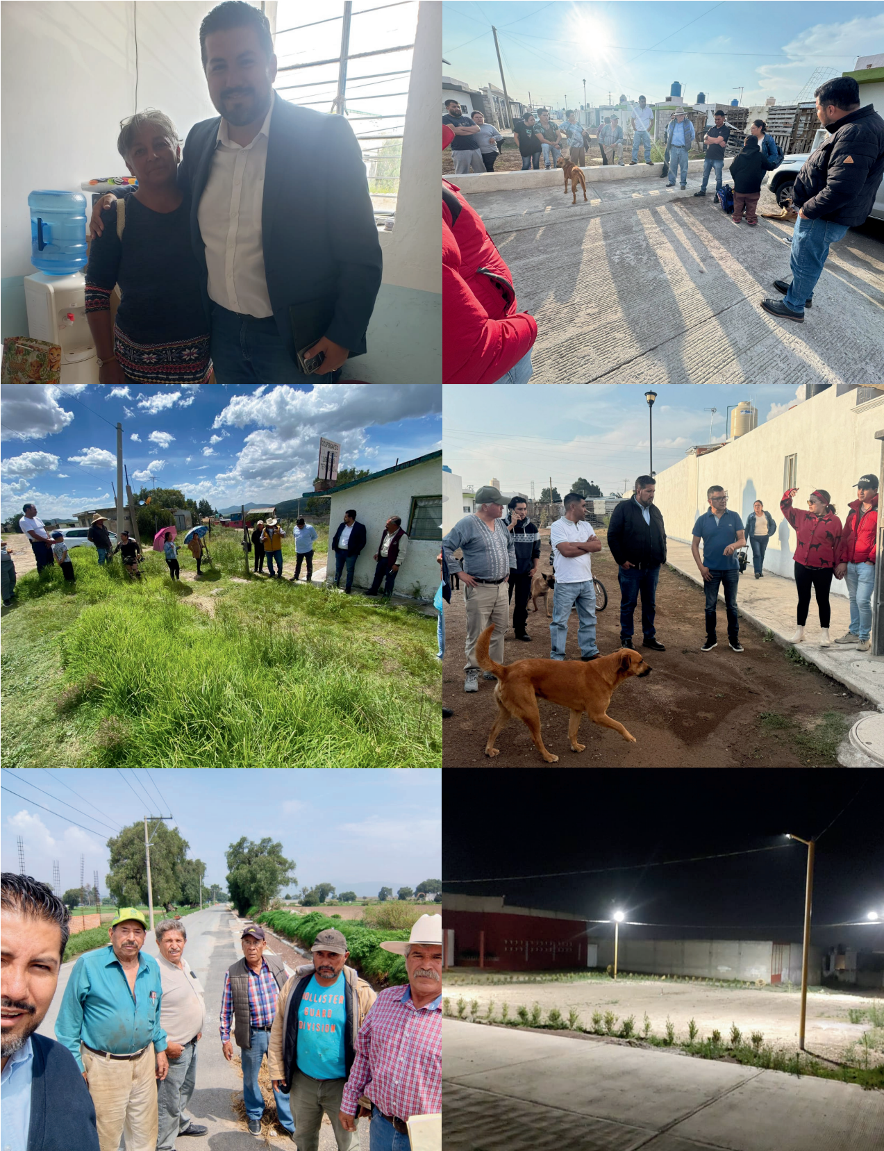
Audiencias Públicas y Ciudadanas